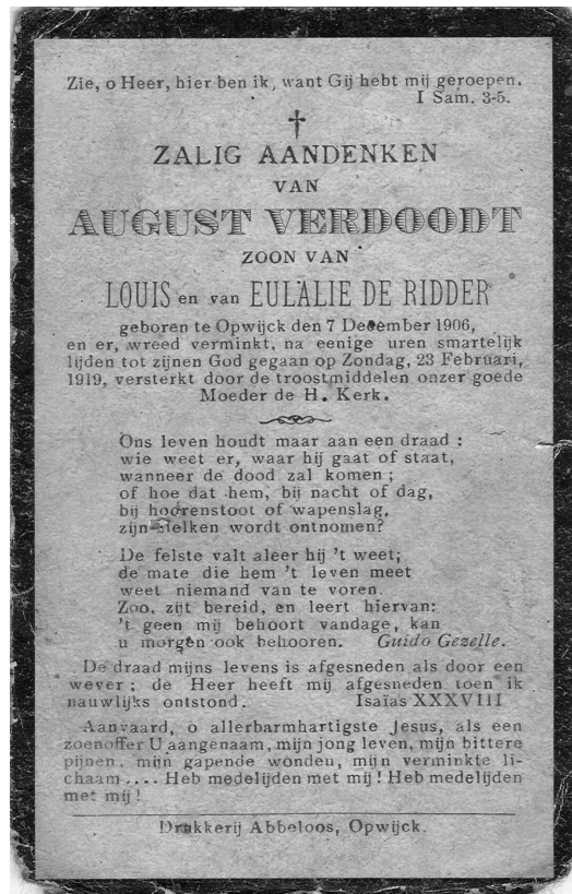
De bidprentjes van de 4 dodelijke slachtoffers van de munitieontploffing op d'Hulst, 23 februari 1919.