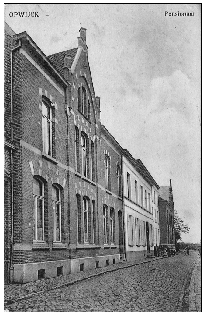
Voorgevel van het Pensionaat Lindemans in de huidige Schoolstraat, ca. 1900.