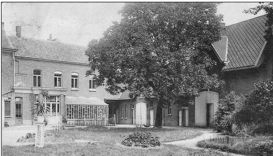
Pensioonaat Lindemans, deel van de woning, tuin en hoeve.