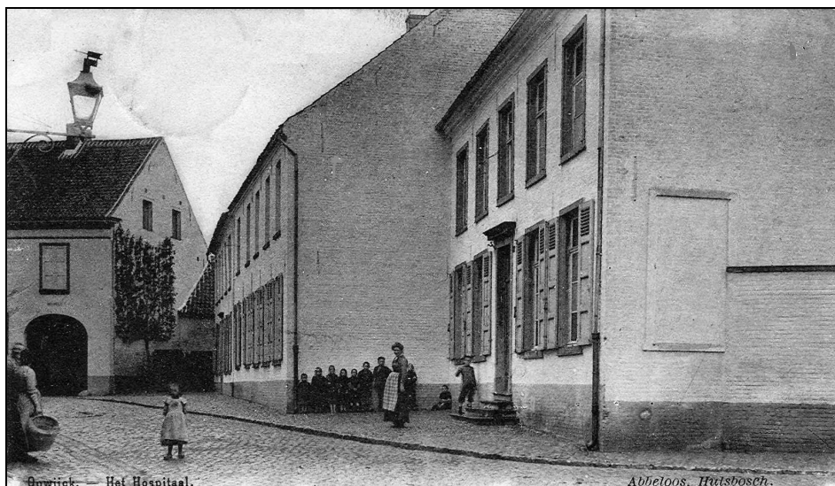
Het oude klooster aan de Marktstraat (huis Rollier, huis Gerlo-Vanstappen en aanpalend huis) en het gasthuis/ziekenhuis/wezenhuis,... langsheen de huidige Gasthuisstraat. Prentbriefkaart van 1904 of vroeger.

In 1913 waren er 210 geprofeste Zusters en 29 huizen. Het aantal toetredingen bedroeg een tiental per jaar. De eerste wereldoorlog onderbrak echter de rustige groei en bloei van de congregatie.