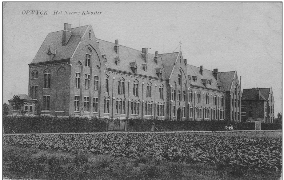
Het nieuwe klooster, gebouwd in 1902-1904 (enkel de vleugel langsheen de straat naar Droeshout - huidige Kloosterstraat).

Hierna brengen wij de integrale tekst van het tiende hoofdstuk "De Congregatie in den oorlog 1914-1918" uit het boek "Hoe zij Groeide. De