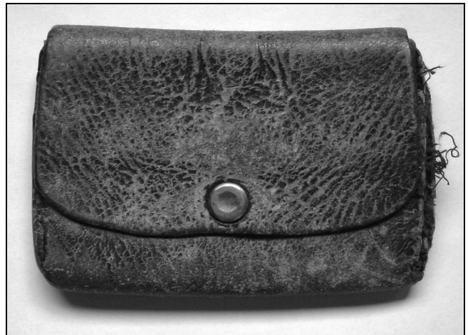
Frontsoldaat Frans Van der Elst "Stoppel" (Mazenzele) droeg deze portemonnaie meer dan vier jaar op zak.

Vanaf 1916 werd het leven "verbeterd". In de loop van 1916 waren de verdedigingswerken zover gevorderd dat de bezetting van de eerste linie tot het minimum beperkt kon worden en de mannen zo min mogelijk aan het vuur werden blootgesteld. Daardoor werden meer mannen achteraan tewerk gesteld en kon zelfs op termijn grotere rustperiodes worden toegeestaan, verder weg van het front.