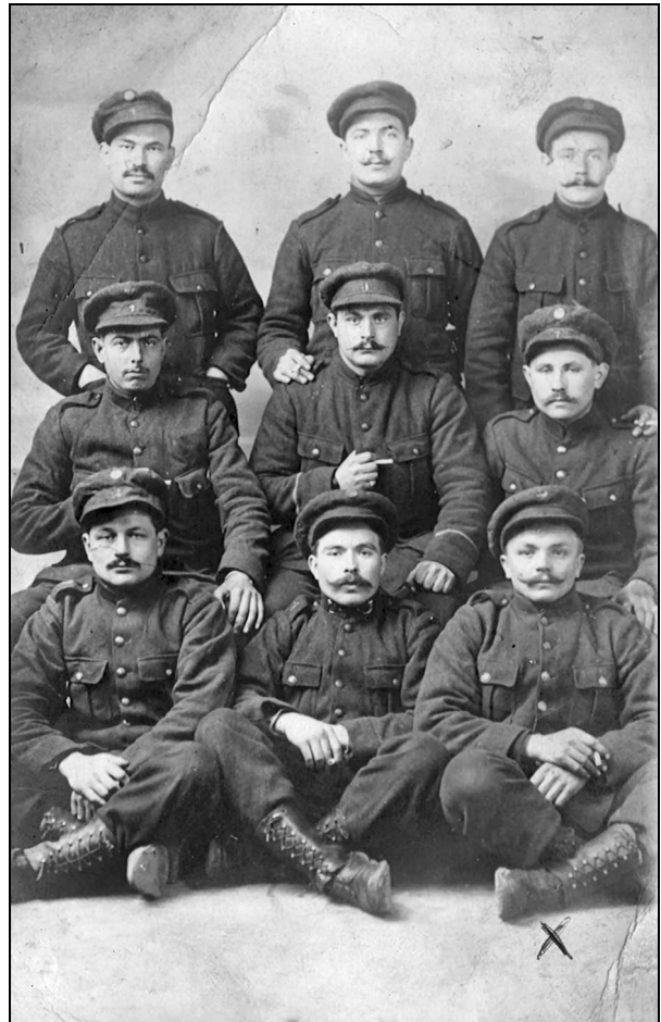
Groepsfoto van Mazelse en Droeshoutse frontsoldaten in 1914 aan de IJzer:

De soldaten hadden nood aan ontspanning en verstrooiing. De mate waarin ze hun gedachten