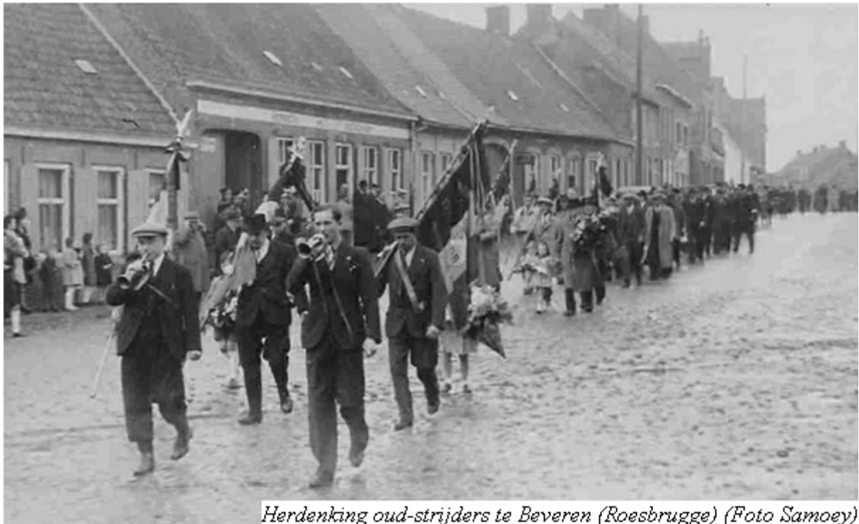
Herdenking oud-strijders te Beveren (Roesbrugge)

artikels te lezen over inhuldigen en feesten ter ere van de veteranen en het einde van de oorlog. De “ V.O.S. ” besteedde in elke editie een pagina aan ‘ Bondnieuws ’, waarbij de plaatselijke V.O.S. -afdelingen berichtten over de festiviteiten, waarbij zij telkens in het middelpunt van de belangstelling stonden 55 . Ook de F.N.C.-N.S.B. maakte melding van gemeentefeesten, waarbij de oud-strijdersverenigingen gevraagd waren om een optocht te houden. Vaak werden de voorzitters gehuldigd op het stadhuis enz. 56 . Het “ Journal des Combattants ” zag dit ook als de logische gang van zaken: men vroeg de bevolking respect te betuigen 57 . In feite was net dit het belangrijkste: de lokale gemeenschappen eerden de oud-strijders. Het was dus geen verering die van hogerop werd opgelegd, hoewel ook die aanwezig was.