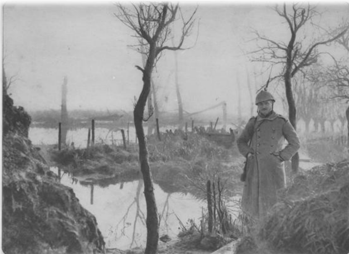
Een Belgische soldaat nabij de 'Poste aquatique N° 1' te Noordschote

Een laatste belangrijk strijdpunt was de tewerkstelling, maar hier is duidelijk geworden dat de tand des tijds ook zijn invloed had op de erkenning en op het effect dat het oud-strijdersdiscours had op de publieke opinie. Groot is het verschil als men denkt aan de dotatie en de toepassing van de wet van 3 augustus 1919, die smalend de “elastieke wet” werd genoemd. Waar de kranten in 1920 mee pleitten voor een voldoening schenkende dotatie, zouden slechts in 1923 de oud-strijderskranten in aparte rubrieken aandacht schenken aan de klachten over de overheidsbenoemingen. De oorspronkelijke wet, net als de wet op de frontstrepen, was dan ook uitgeschreven in een periode waarin de erkentelijkheid het grootste was. Na verloop van tijd had het helden- en slachtofferdiscours geen effect meer. Erkenning is dus vergankelijk!