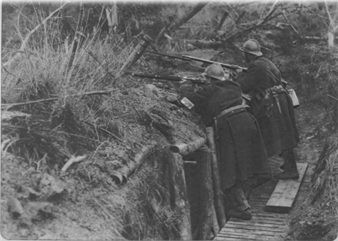
Belgische soldaten in veroverde loopgraaf

had tot dan nog steeds van het lotingsysteem gebruik gemaakt. Om een volwaardig leger te krijgen was de algemene dienstplicht nodig, die in 1913 werd ingevoerd, waardoor er 33.000 i.p.v. 19.000 rekruten werden ingelijfd. Bij aanvang van de oorlog zou men er in slagen om 117.000 eenheden op te roepen 2 . Het hele idee was dat men zich bereid diende te tonen om de neutraliteit zo goed mogelijk te verdedigen. Veel meer dan deze strijd lust zou men immers toch niet tegenover de Duitse legermachine kunnen plaatsen, zo dacht men. Toen Duitsland binnenviel, meldden er zich nog eens twintigduizend vrijwilligers 3 .