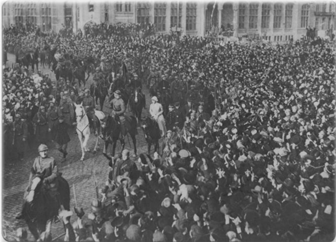
De intocht van de koninklijke familie te Gent op 13 november 1918