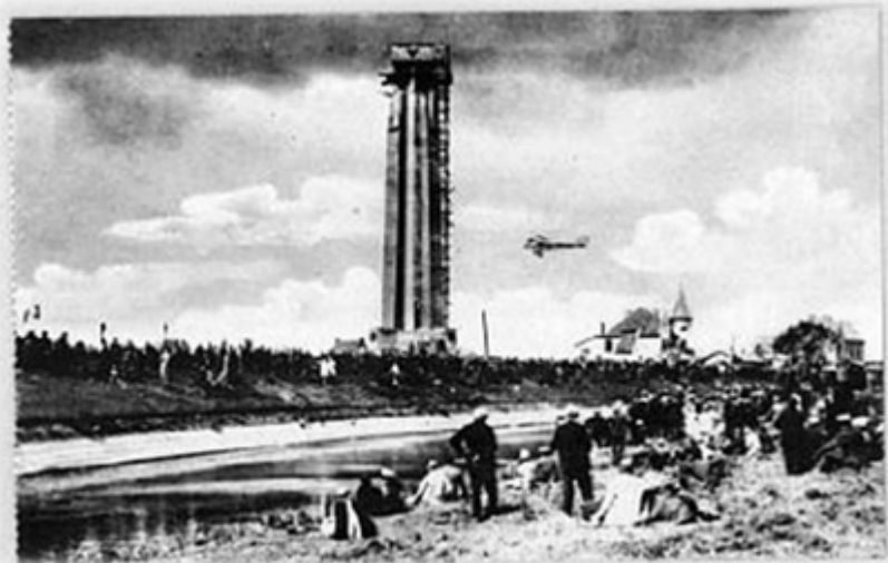
[Caeskerke (Dixmuide): monument]

Een andere Vlaamse hoogdag waar de V.O.S. ook zijn opwachting maakte, was de jaarlijkse IJzerbedevaart die in 1920 begonnen was als een herdenkingsmoment voor de Vlaamse gesneuvelden uit de Eerste Wereldoorlog. Al snel zou het altaar aangevuld worden met een politieke tribune waar het idee van zelfbestuur zou gepredikt worden en waar