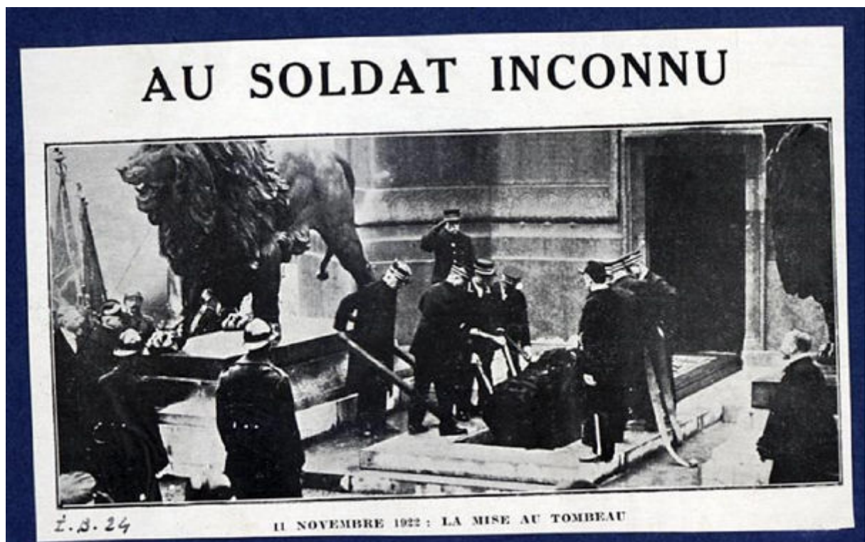
[Bruxelles]: au Soldat Inconnu: 11 novembre 1922: la Mise au Tombeau

moeten oprichten in Brussel en meer bepaald dicht bij het Justitiepaleis als symbool voor het feit dat België enkel naar de wapens gegrepen had om zijn geschonden recht te verdedigen 17 . Na lang getalm kwam er in 1922 eindelijk schot in de zaak. Men zou de knoop doorhakken waar het monument, dat bij wet opgericht diende te worden, zou komen. De eerste voorgestelde plaats was het plein voor het Paleis der Natie achter het hek, maar de burgemeester van Brussel, Max, vond het geen goed plan om dit te vestigen in de neutrale zone. Drie mogelijke plaatsen bleven bespreekbaar: de Cinquantenaire, het Poelaertplein en de Congresskolom. Het eerste leek te ver, de tweede plaats te klein. Uiteindelijk begon de voorkeur in de richting van de Congresskolom over te hellen, omdat men voor de 11 november-viering (cf. infra) een vaste plaats zocht 18 . Men keurde een amendement goed waarbij besloten werd om de Onbekende Soldaat te begraven aan de Congresskolom, onder het Monument, en de inhuldiging op 11 november 1922 te laten plaatsvinden 19 .