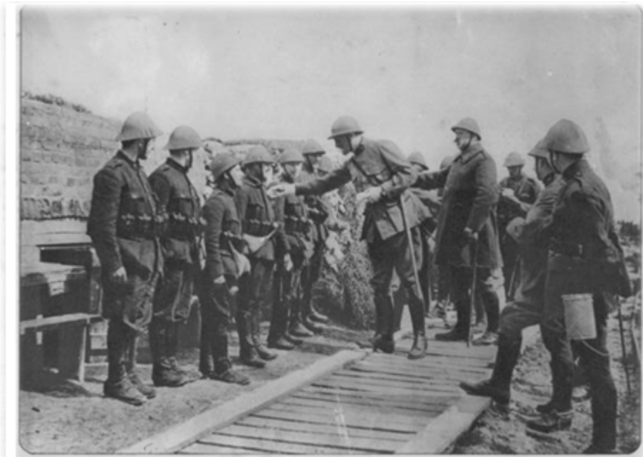
Generaal De Witte beloont zijn soldaten (loopgraaf te Ramskapelle, juli 1916)

Verder onderzocht luitenant-generaal De Ceunick nog voor de Wapenstilstand in hoeverre dat men een eretecken aan alle oud-strijders kon geven 77 . Dit