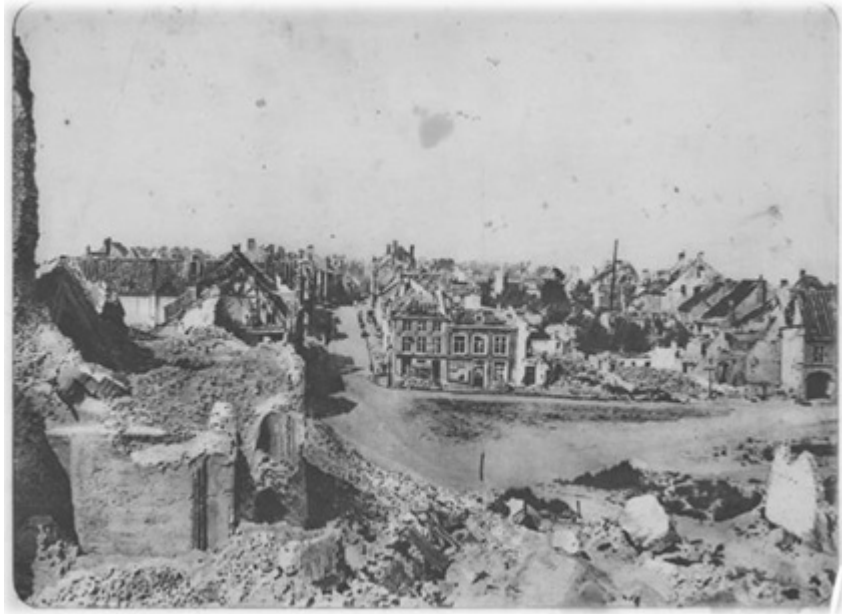
Panorama van de ruïnes van Nieuwpoort

Aanvankelijk was er een wet opgesteld, waardoor de burgerbevolking integraal vergoed zou worden door de inning van de Duitse herstelbetalingen; dit alles verklaart waarom België hevig aandrong op een snelle vereffening. De quota's werden echter per land pas in juli 1920 vastgelegd; ons land zou 8% van het totaalbedrag krijgen. Er ontstond echter een enorme vertraging bij