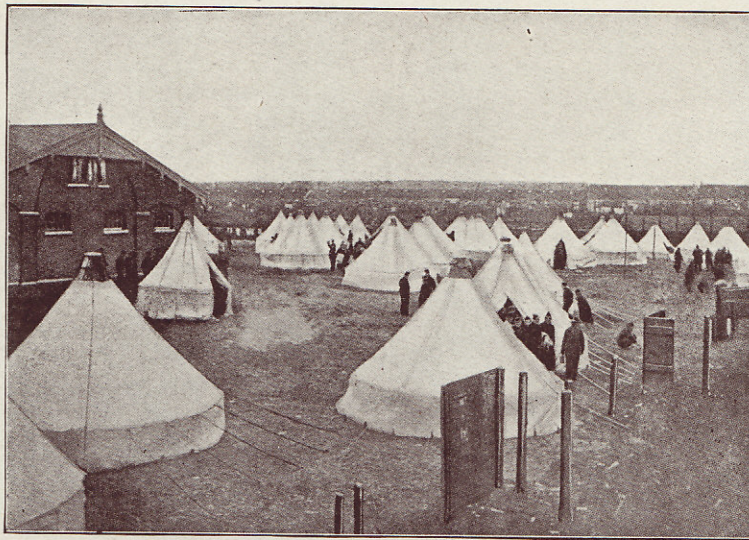
Kamp van Belgische en Engelsche soldaten, in Holland geïnterneerd.

Een groot vraagstuk tevens was de werkverschaffing aan de militaire kampbewoners. Vanaf 1916 konden de geïnterneerden bij de Hollandsche particulieren tewerk worden gesteld. Na drie jaar waren ongeveer 12,000 geïnterneerden in verschillende steden en dorpen van Nederland werkzaam; waar ze administratief ingedeeld werden in zogenaamde depots, en er hun maaltijden namen en vernachtten. Die depots stonden onder het bevel van een Nederlandschen officier of onder-officier, volgens de belangrijkheid van de groepeerings-