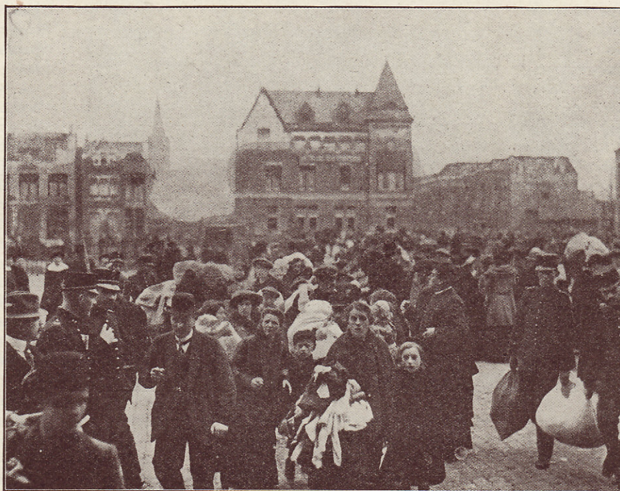
Een aankomst te Rosendael van uitgeweken Belgen.

Al dadelijk werd het moeilijker hun de noodige bewegingsvrijheid te geven voor het verrichten van werkzaamheden, omdat men ze dan niet kon bewaken ter voorkoming van ontvluchting. De Nederlandsche Staat bevond zich toen in een zeer moeilijke positie. Volgens de internationale rechtsjurisprudentie moet de militair, indien hij geen belofte heeft afgelegd of geen bevelen heeft van zijn Regeering, trachten zich bij zijn wapenbroeders te voegen, zodra hij daartoe gelegenheid vindt. De neutrale Staat mag van zijn kant zulke ontvluchtingen niet toestaan, daar hij hierdoor, zij het onrechtstreeks, één der oorlogvoerende partijen zou begunstigen en dus niet meer neutraal zou zijn. Maar anderzijds is het voor den neutralen Staat moeilijk om, zonder de andere