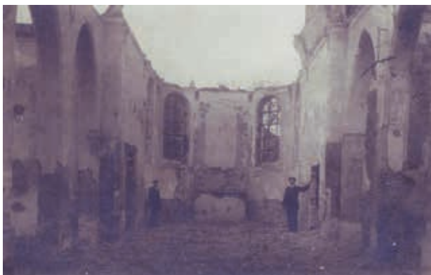
De door oorlogsgeweld zwaar geteisterde Onze-Lieve-Vrouwekerk in Mariekerke (Bornem).