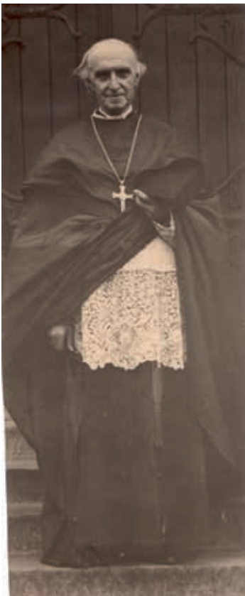
Kardinaal Joseph-Désiré Mercier

Honderd jaar na het begin van de Eerste Wereldoorlog worden ontelbare grote en kleine projecten gelanceerd die de geschiedenis van die oorlog evoceren. Nu de laatste generatie rechtstreekse getuigen bijna helemaal is uitgestorven, zijn verhalende bronnen die tijdens of vlak na de oorlog tot stand kwamen voor historici van cruciaal belang. Persoonlijke notities en dagboeken uiteraard, maar ook bronnen die laten zien hoe de oorlog vier jaar lang het leven in dorpen en steden ontwrichtte. Als spilfiguren in de lokale gemeenschappen van toen waren de pastoors bevoorrechte waarnemers om verslag te doen over de impact van die oorlog op het dagelijks leven in hun parochies. Wat zij over de oorlogsjaren neerschreven is zonder meer een belangrijke bron voor wie aan de slag wil met de geschiedenis van zijn dorp of stad tijdens de Groote Oorlog .