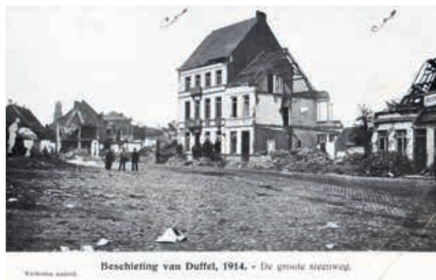
Het centrum van Duffel na de Duitse beschietingen in 1914.

en heemkundige kringen, scholen en/of lokale historici aanleiding om met de parochieverslagen aan de slag te gaan. Inspelend op die hernieuwde belangstelling voor de Grote Oorlog hebben de Belgische bisdommen en het Algemeen Rijksarchief het initiatief genomen om de bewaard gebleven verslagen te digitaliseren. Op die manier zullen ze voor onderzoekers optimaal worden ontsloten en toegankelijk gemaakt. Nadat de verslagen zijn gedigitaliseerd is het bovendien niet langer nodig om de originele documenten in lezing te geven (en te fotokopiëren) waardoor ze kunnen worden gespaard. Dit digitaliseringsproject verhoogt dus de mogelijkheid tot consultering en draagt tegelijk bij tot de conservering van de originele verslagen op de langere termijn. Twee vliegen in één klap, dus.