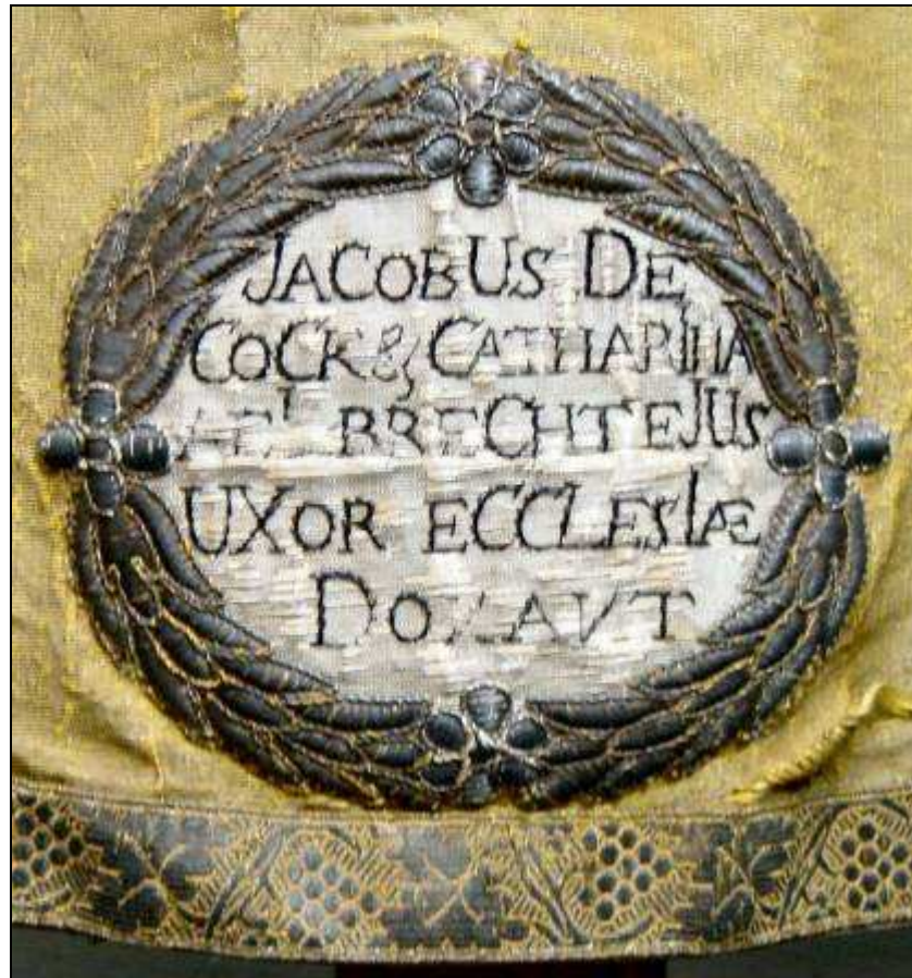
Vermelding van de schenkers (in jaarschrift) op de koorkap uit 1827 (nr. 12).